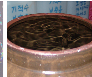
Une image ressemblant à de la lave brûlante dans l'Eau miraculeuse.