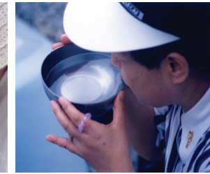
Une image de l'Eucharistie est apparue dans l'Eau miraculeuse.